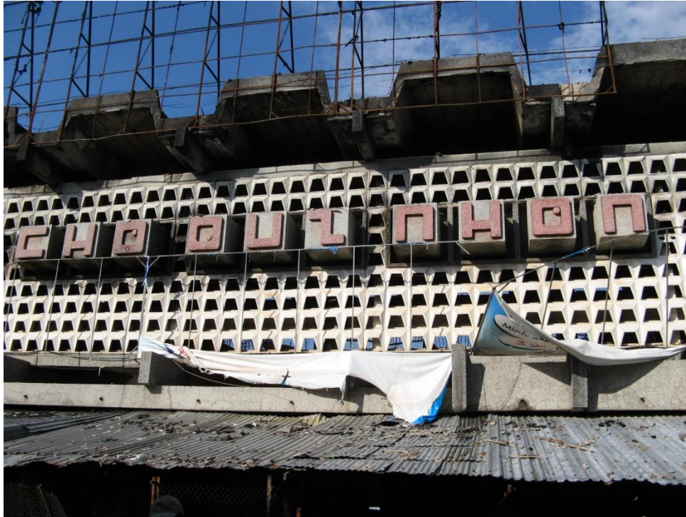
Ảnh 1: Dấu vết ám khói thể hiện điểm xuất phát cháy nằm ở phía trong nửa nhà bên phải. Hệ thống cửa ở trạng thái đóng.

Như ta đã biết cháy là một quá trình phức tạp xảy ra theo nhiều giai đoạn, nếu quan sát vùng ngọn lửa ta thấy các hợp chất hữu cơ đã bị phân hủy thành các hạt cacbon cháy sáng. Khi sự cháy không hoàn toàn các hạt cacbon đi ra khỏi ngọn lửa không còn cháy sáng nữa và tạo thành đám khói đen. Những đám khói đen này khi tiếp xúc với các bề mặt có nhiệt độ thấp hơn chúng sẽ bị ngưng tụ tạo thành vết ám khói đen. Quá trình ngưng tụ khói là một quá trình hấp phụ bề mặt và là một quá trình phát nhiệt vì vậy mức độ ám khói đen ngoài yếu tố nồng độ khói, mức độ tiếp xúc của bề mặt còn phụ thuộc vào nhiệt độ của bề mặt mang dấu vết. Nhiệt độ của bề mặt thấp thuận lợi cho việc hấp phụ, nhiệt độ của bề mặt cao quá trình hấp phụ khó khăn hơn. Khi đám cháy đã phát triển, các bề mặt xung quanh nó bị đốt nóng đến một lúc nào đó quá trình hấp phụ không xảy ra hoặc những dấu vết ám khói xảy ra từ trước bị giải hấp phụ.