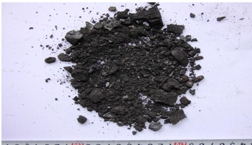
Ảnh 16: Tàn than tro