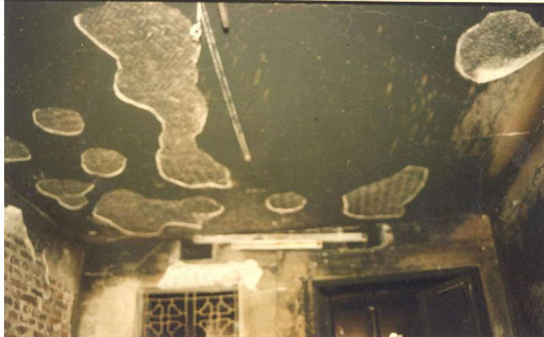
Ảnh 7: Dấu vết bong tróc trên trần nhà

Bên trong các bề mặt thông thường đều tiềm tàng những túi không khí. Khi gặp nhiệt độ cao cả bề mặt và túi không khí bị giãn nở gây ra các dấu vết phòng rộp và bong tróc.