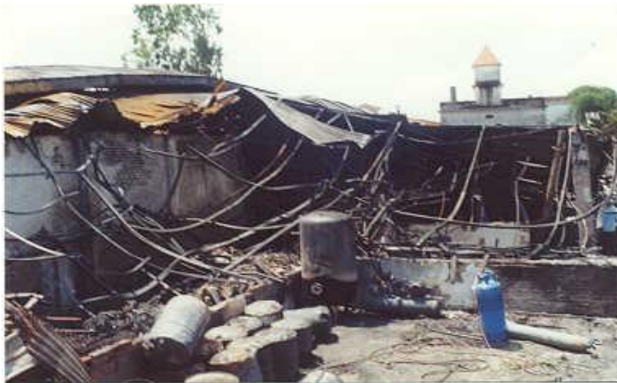
Ảnh 5: Dấu vết cong vênh biến dạng của hệ thống dàn mái