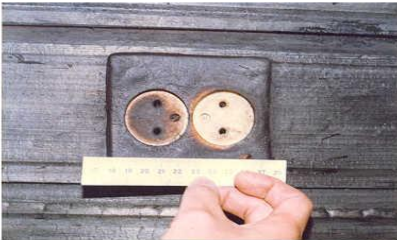
Ảnh 13: Dấu vết che khuất ở ổ cắm bên phải chứng minh sự có mặt của phích cắm trước và trong khi cháy.

Các dấu vết in hàn che khuất trong các đám cháy có ý nghĩa lớn trong việc xác định trạng thái ban đầu của các vật thể trước khi cháy.