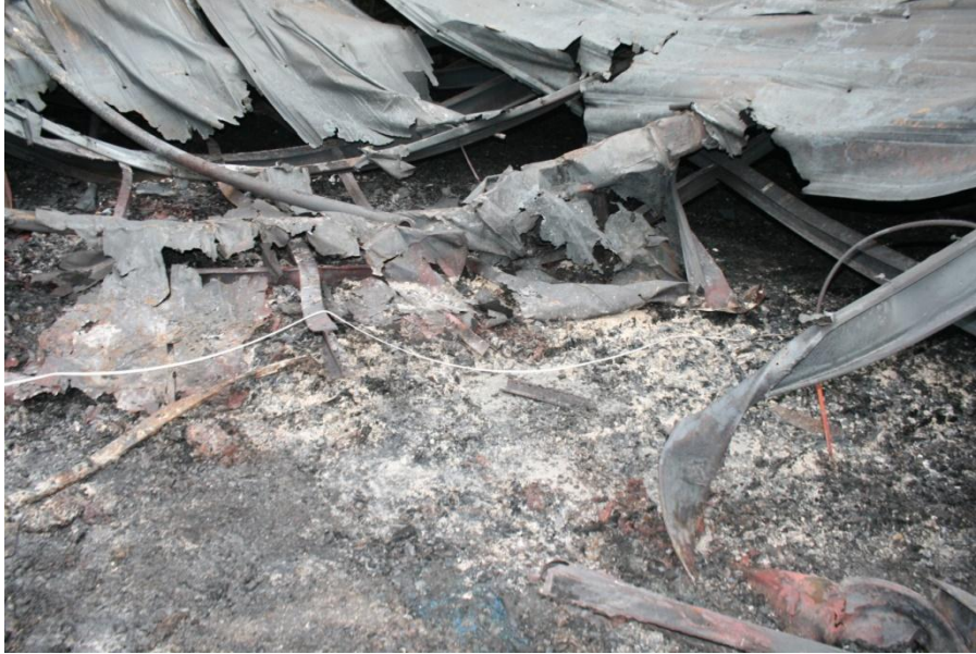
Ảnh 17: Dấu vết tàn trắng nằm sát nền hiện trường phản cháy cường độ cháy trong điều kiện đủ oxy