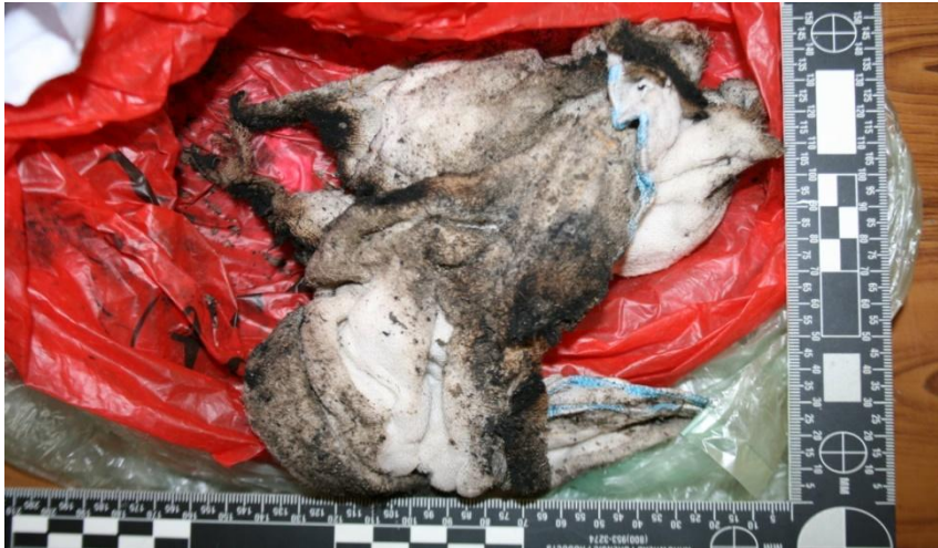
Ảnh 15: Chiếc giẻ bị nhiệt tác động

Các dấu vết chất và vật liệu thường có liên quan chặt chẽ với nguyên nhân cháy. Thuộc loại dấu vết này chúng ta thường bắt gặp dấu vết của các chất điểm hoá như thuốc cháy, thuốc pháo hoặc các chất dẫn lửa mạnh như xăng dầu, giẻ tẩm xăng dầu... Các dấu vết này được khai thác về khía cạnh bản chất của vật chất, nằm trong mối quan hệ trực tiếp với đối tượng gây án và động cơ gây án.