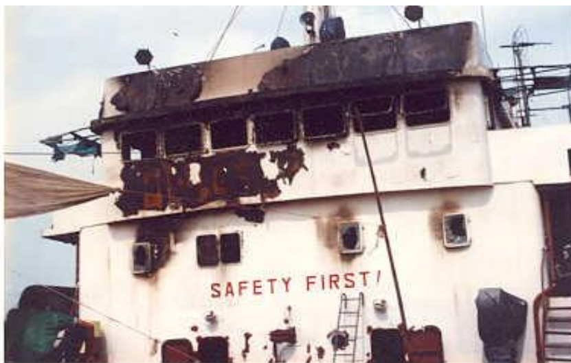
Ảnh 8: Dấu vết phòng rộp phía trước và bên trái mạn tàu

Các dấu vết phòng rộp trên bề mặt có tấm phủ chất bảo vệ cũng phản ánh chiều hướng và mức độ tác dụng nhiệt của ngọn lửa.