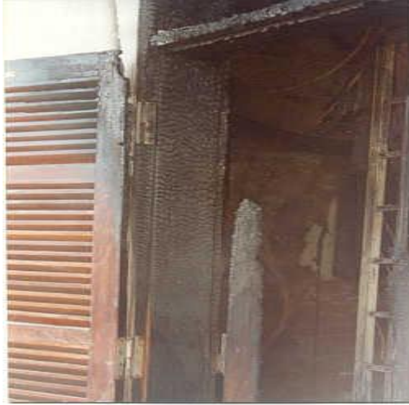
Ảnh 3: Dấu vết than hoá trên thành cửa chỉ rõ hướng cháy từ trong ra ngoài và từ trên xuống, cửa ở vị trí mở