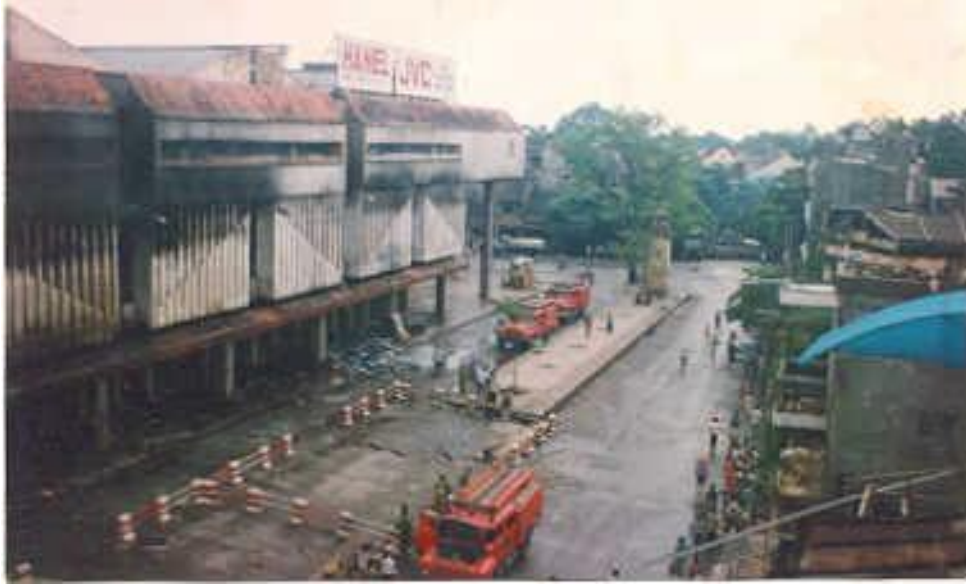
Ảnh 2: Dấu vết ám khói ở phía tường ngoài chợ Đồng Xuân thể hiện vùng cháy đầu tiên và điểm xuất phát cháy.

Dấu vết ám khói đen cho phép chúng ta xác định được sự hiện diện của ngọn lửa, xác định chiều hướng và mức độ của ngọn lửa và điều quan trọng hơn cả là khoảng thời gian xuất hiện ngọn lửa tạo nên dấu vết ám khói. Các dấu vết ám khói đen thường được hình thành và tồn tại trên các bề mặt phẳng như bề mặt tường, cửa kính, cửa gỗ ... Trong công tác KNHT cháy, dấu vết ám khói đen vừa mang tính phổ biến lại vừa chứa đựng nhiều thông tin quan trọng vì vậy cần phải được tập trung khai thác .