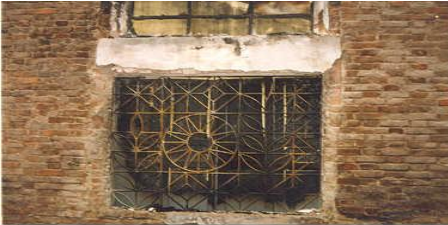
Ảnh 11: Dấu vết rạn nứt trên tấm kính cửa sổ

Sự rạn nứt có thể được gây ra do tác động của lực cơ học hoặc do nhiệt. Trong các hiện trường cháy chúng ta thường bắt gặp rất nhiều dấu vết rạn nứt trên gỗ, sứ và đặc biệt là trên thủy tinh. Các dấu vết rạn nứt trên kính có thể được bắt gặp riêng rẽ nhưng cũng có thể đi liền với các dấu vết khác, đặc biệt là dấu vết ám khói. Cũng như hầu hết các vật liệu khác, khi bị nóng thủy tinh giãn nở theo từng phần, từng lớp khác nhau và gây ra sự nứt vỡ. Đặc điểm của dấu vết rạn nứt do nhiệt trên thủy tinh là các đường ngoằn ngoèo và thông thường các nhánh nứt vỡ bị rơi về phía tác dụng nhiệt.